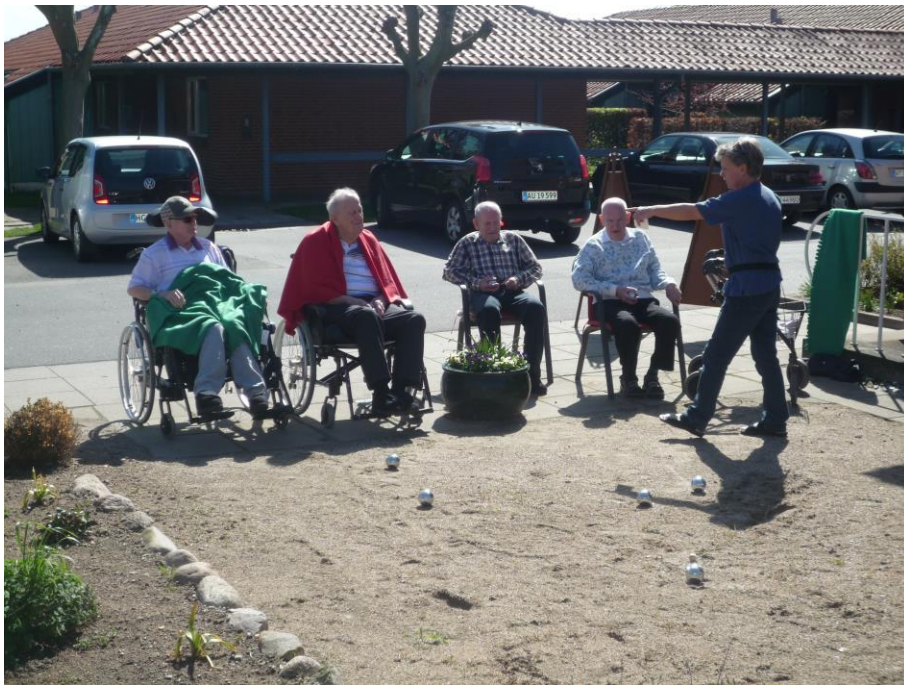
Petang på Dalsbo