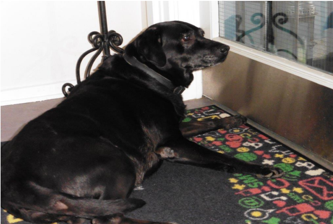
”Mimmi” – Dalsbo hund.

Gør når der kommer gæster, men vil gerne snakke