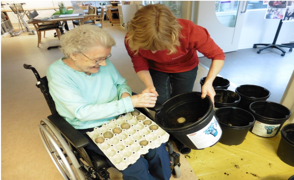
Der lægges kartofler til spiring