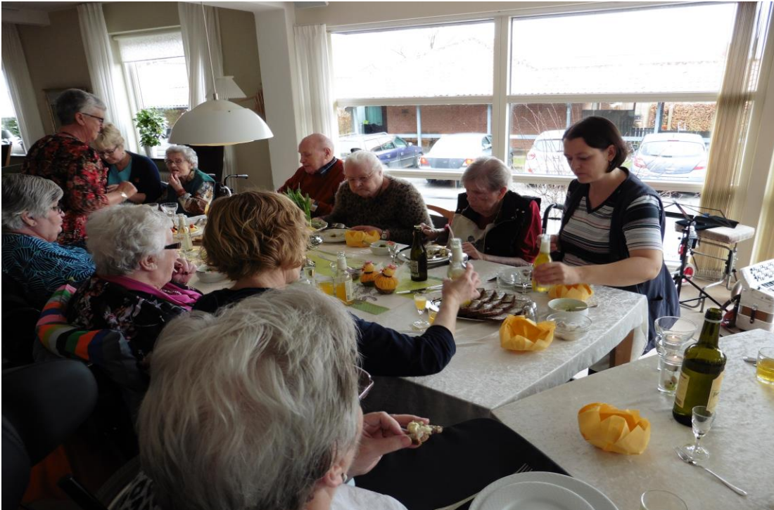
Påskefrokost på Dalsbo

Du og din familie sorterer løbende tøjet: for småt, for stort eller for slidt.