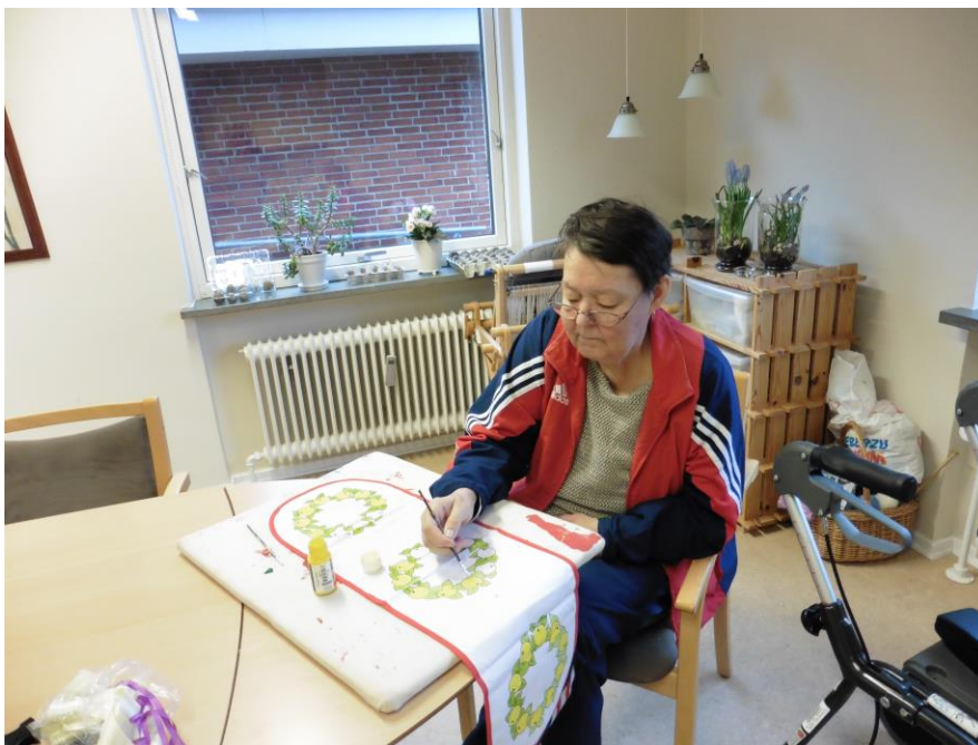
Der males bordløber