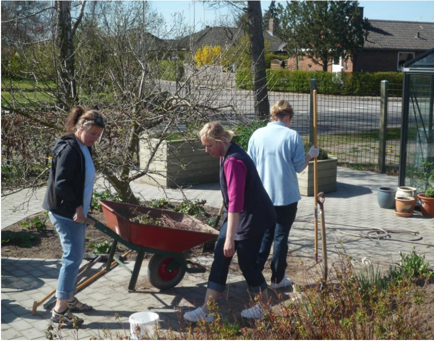
Forårsrensning i haven