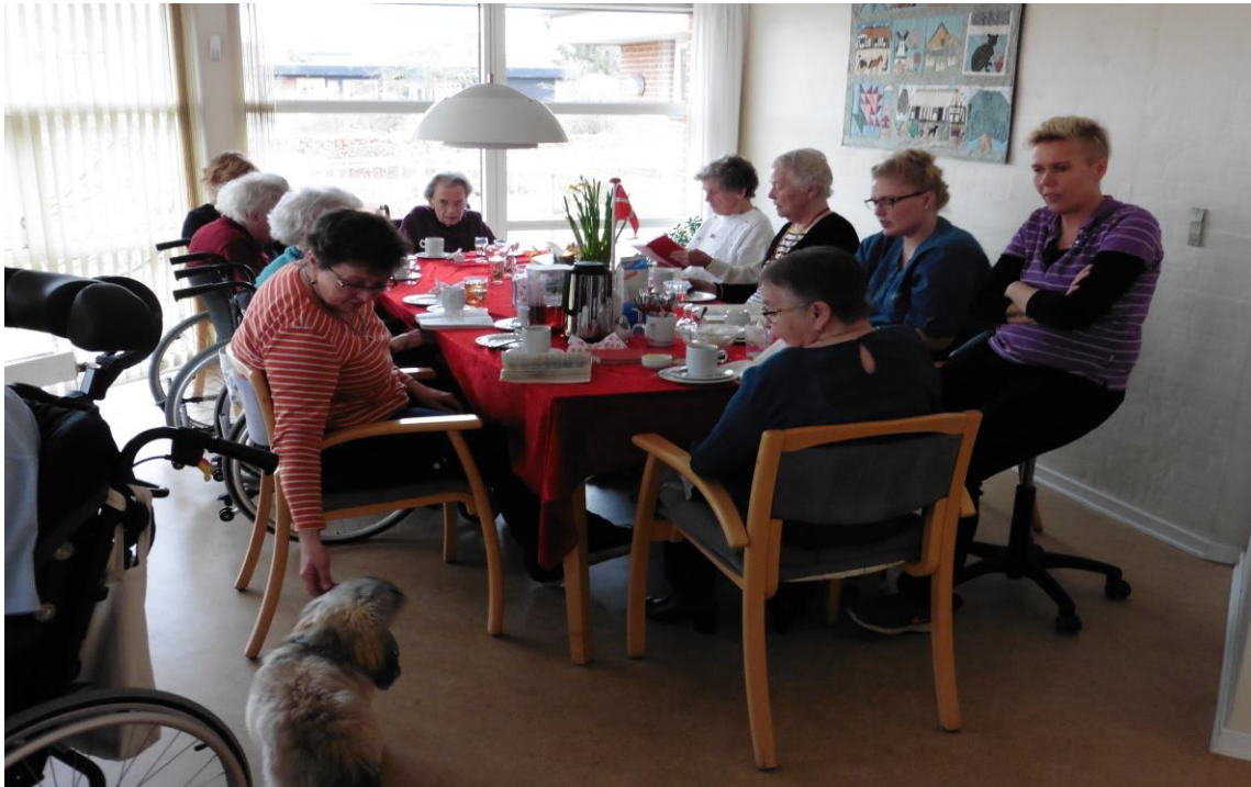
Fødselsdag på Dalsbo